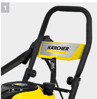
1 Складная рама